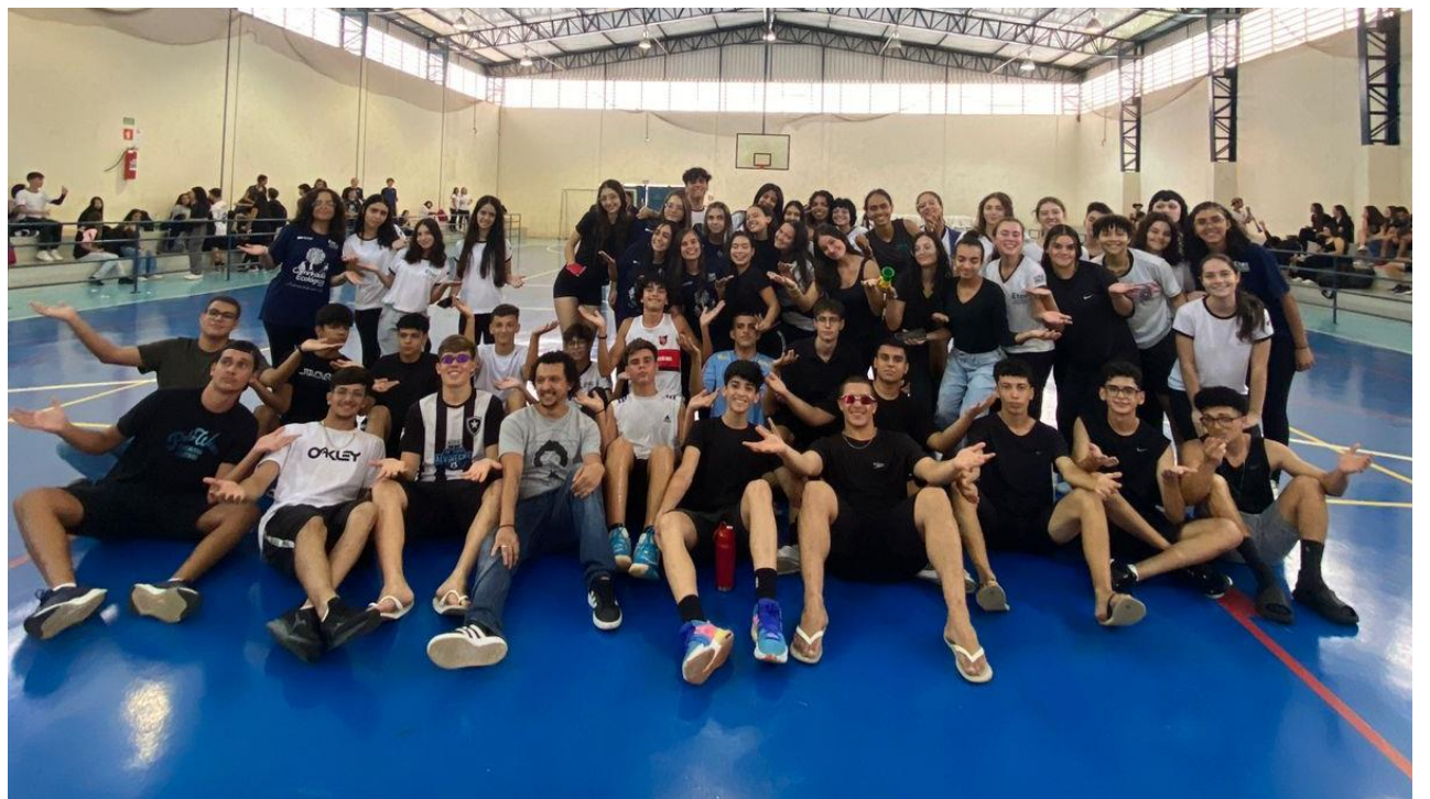
Alunos vencedores dos jogos.

Uma das maiores vantagens das ETECs é a sua forte ênfase na prática. Os alunos têm a oportunidade de aplicar o conhecimento teórico em projetos reais, em laboratórios bem equipados e em parceria com empresas e instituições locais. Esse aspecto prático não apenas enriquece a experiência educacional, mas também prepara os estudantes para os desafios do mercado de trabalho, tornando-os profissionais mais qualificados e capacitados. Além disso, as ETECs desempenham um papel crucial na redução das desigualdades sociais, oferecendo educação técnica de alta qualidade a estudantes de diversas origens socioeconômicas. Ao proporcionar oportunidades de formação profissional a jovens, as ETECs contribuem significativamente para a inclusão social e para a promoção da igualdade de oportunidades. Não podemos ignorar também o impacto das ETECs no desenvolvimento regional. Ao formar profissionais qualificados, essas escolas ajudam a suprir a demanda por mão de obra especializada em setores-chave da economia local, impulsionando o crescimento e a competitividade das regiões em que estão inseridas.